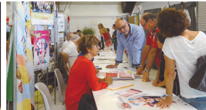
Forum des associations, un succès renouvelé !