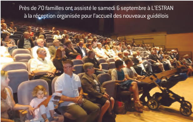
Près de 70 familles ont assisté le samedi 6 septembre à L'ESTRAN à la réception organisée pour l'accueil des nouveaux guidétois