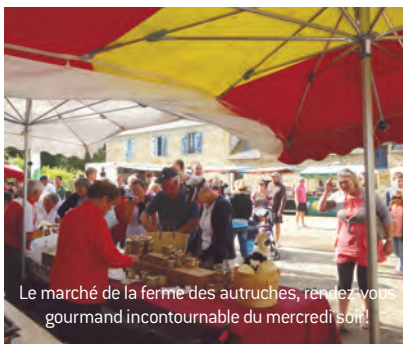
Le marché de la ferme des autruches, rendez-vous gourmand incontournable du mercredi soir !