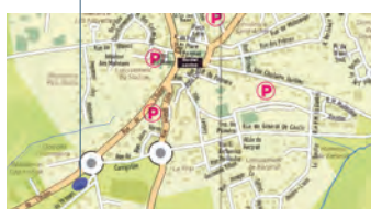
Le projet à Kergroëz

Une enquête publique est en cours, pour la cession par la ville à "l'Aiguillon" d'un foncier permettant la construction de 22 logements à Kergroëz. Et deux programmes sont en phase de réalisation : 58 logements au Gouéric par Bretagne Sud Habitat, et prochainement 9 logements au Clos Brizeux par LB Habitat.