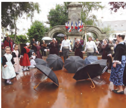
Une "danse des parapluies" improvisée lors du traditionnel kir breton offert par la municipalité les dimanches matins d'été.