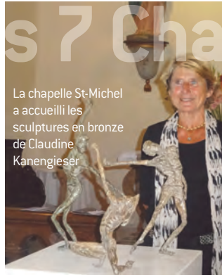
La chapelle St-Michel a accueilli les sculptures en bronze de Claudine Kanengieser