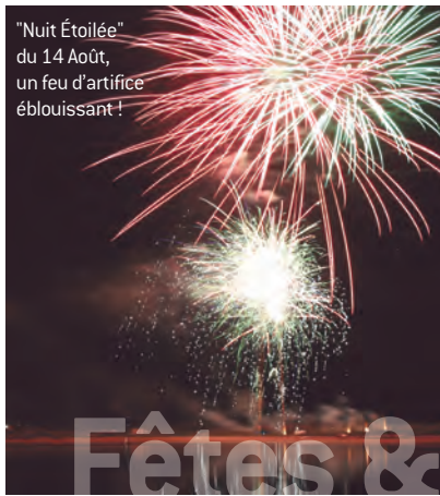
"Nuit Étoilée" du 14 Août, un feu d'artifice éblouissant !