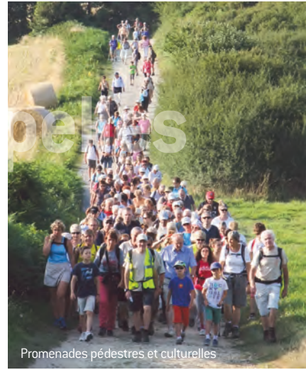
Promenades pédestres et culturelles