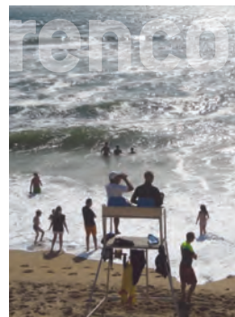
Des nageurs sauveteurs de la SNSM, des saisonniers titulaires du BNSSA et des CRS ont veillé sur nos baignades