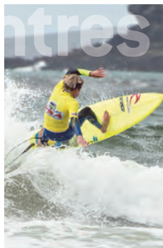
Western surf Festival