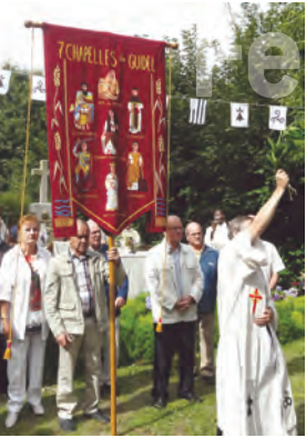
Le pardon de la Pitié, bénédiction de la bannière des 7 chapelles