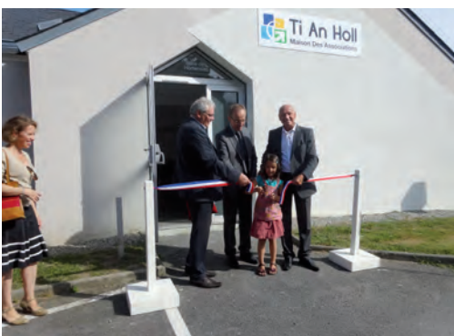
Inauguration le 13 septembre de Ti An Holl, la Maison des Associations Guidétoises