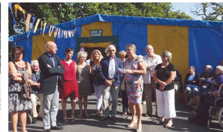
Les 20 ans de la MAPA