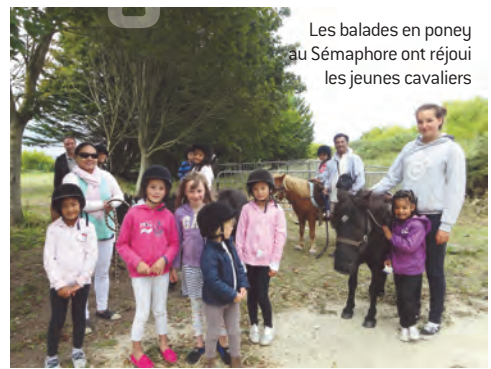
Les balades en poney au Sémaphore ont réjoui les jeunes cavaliers