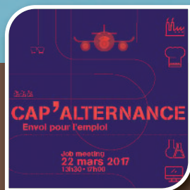
Vie Locale // 12 Forum Cap'alternance envol vers l'emploi le 22 mars