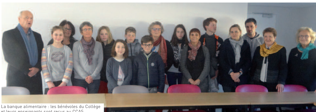
La banque alimentaire : les bénévoles du Collège et leurs enseignants sont reçus au CCAS