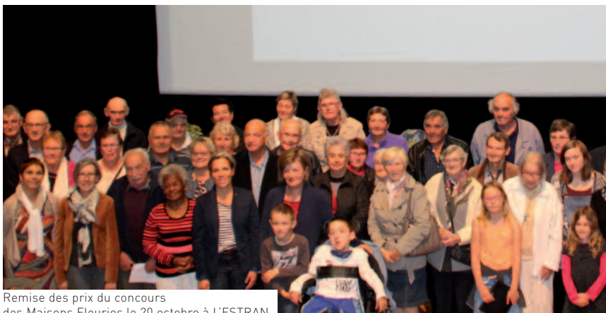
Remise des prix du concours des Maisons Fleuries le 20 octobre à L'ESTRAN