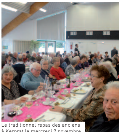
Le traditionnel repas des anciens à Kerprat le mercredi 9 novembre