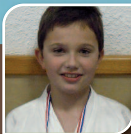
Vie Locale // 13 Karaté, un vif succès à Guidel à tous les âges