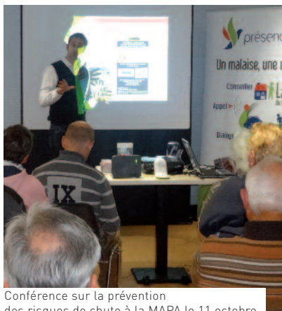
Conférence sur la prévention des risques de chute à la MAPA le 11 octobre