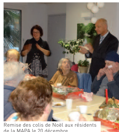
Remise des colis de Noël aux résidents de la MAPA le 20 décembre