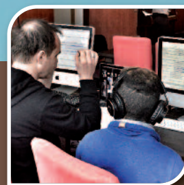
Culture // 14 Des collégiens à la base d'une création à l'ESTRAN