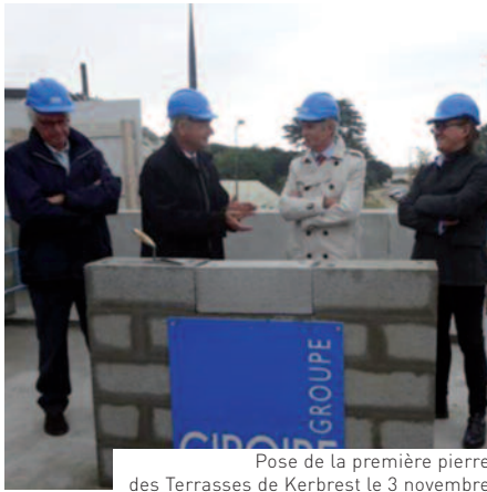
Pose de la première pierre des Terrasses de Kerbrest le 3 novembre