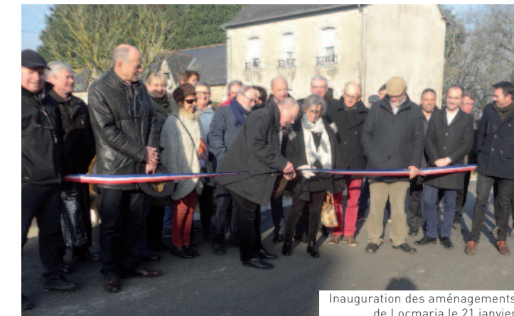
Inauguration des aménagements de Locmaria le 21 janvier