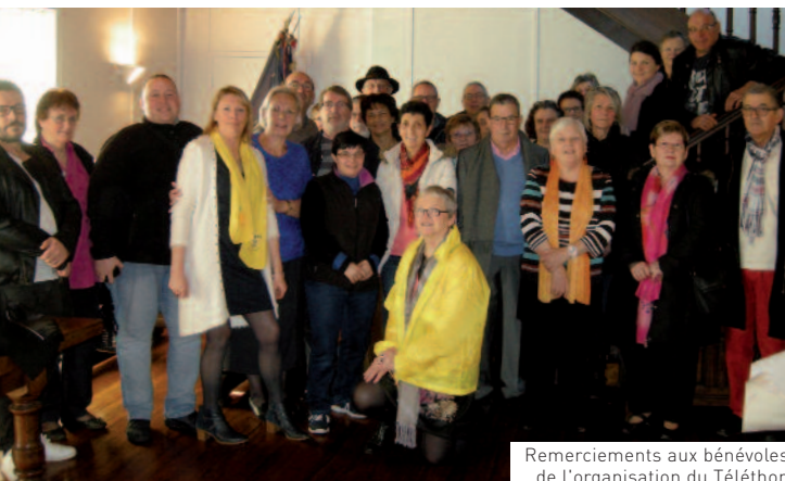
Remerciements aux bénévoles de l'organisation du Téléthon