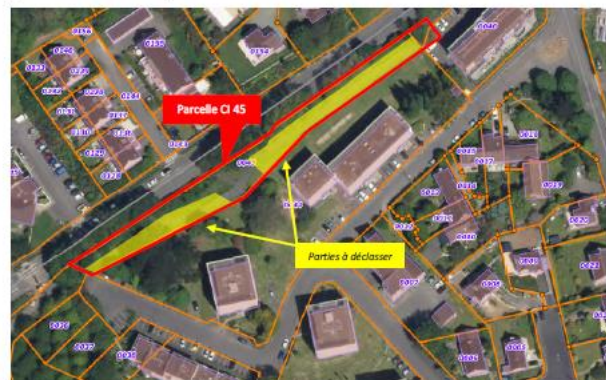
Parties de la parcelle CI 45 qui seront cédées pour les projets de requalification urbaine

La restructuration de ces différents espaces publics et privés nécessite le déclassement d'une surface d'environ 800 m 2 de la parcelle CI 45.