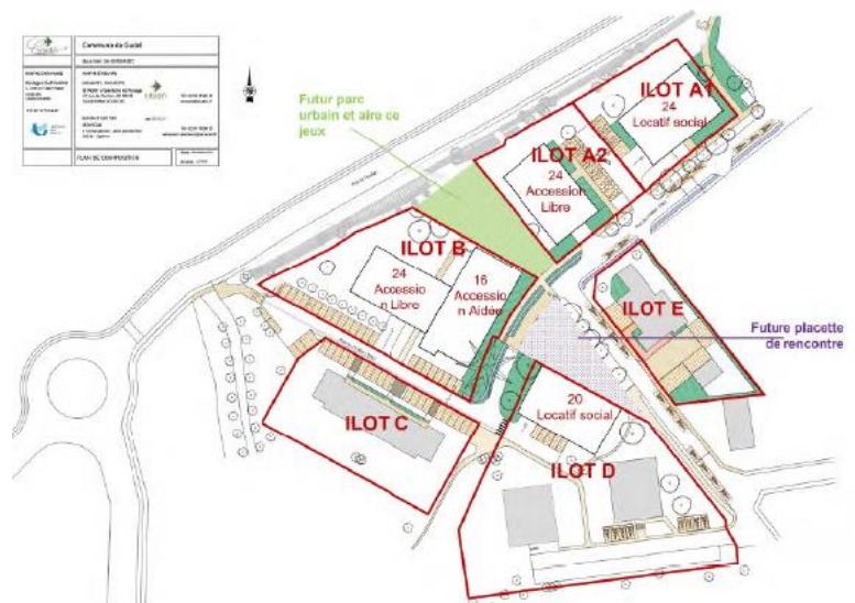
Plan de composition de la requalification urbaine du quartier de KERGROEZ (Sitadif, Servicoa, décembre 2022)