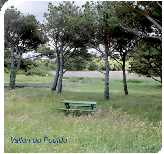
Vallon du Pouldu