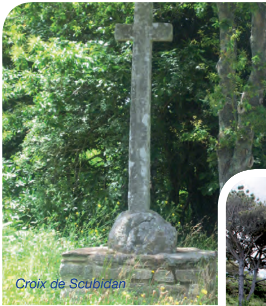
Croix de Scubidan