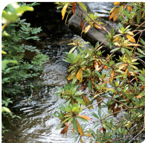
Ruisseau « l'Orven »

Avec le moulin à vent du Méné et les deux moulins de la Saudraye, les anciens moulins du site Moulin-Orvoën constituent les seuls vestiges visibles de nos jours, de l'ancien château de la Saudraye aujourd'hui totalement disparu.